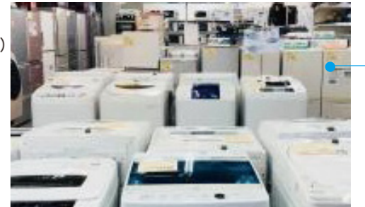
写真1点(角版) ※組み写真・合成写真・ イラスト・ロゴ不可